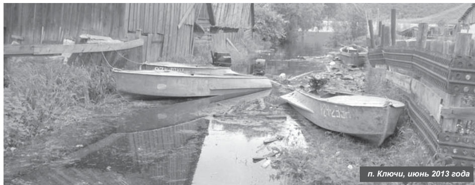
п. Ключи, июнь 2013 года

Главам поселений рекомендовано уточнить расчёты по организации эвакуации населения и материальных ценностей из зон возможного подтопления, подготовить пункты временного размещения людей, спланировать и обеспечить мероприятия по первоочередному жизнеобеспечению населения. Также создать резервы материальных ресурсов для ликвидации чрезвычайной ситуации, связанных с прохождением весеннего паводка, и обеспечить очистку водоохранной зоны и зон потенциального подтопления от отходов, загрязняющих веществ и потенциальных источников загрязнения.