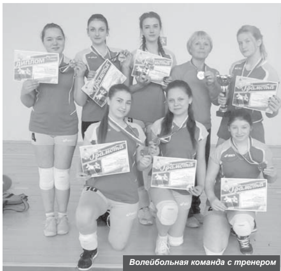
Вolleyball команда с тренером

Спортсмены Усть-Камчатского района продолжают радовать земляков своими достижениями и результатами в соревнованиях. Об этом рассказали в отделе культуры, молодёжной политики, спорта и туризма районной администрации.