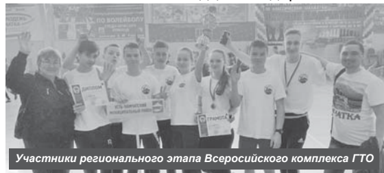
Участники регионального этапа Всероссийского комплекса ГТО

СПЕШИТЕ КЛЮЧИ С 7 АПРЕЛЯ ПО 14 АПРЕЛЯ КОЗЫРЕВСК С 9 АПРЕЛЯ ПО 14 АПРЕЛЯ